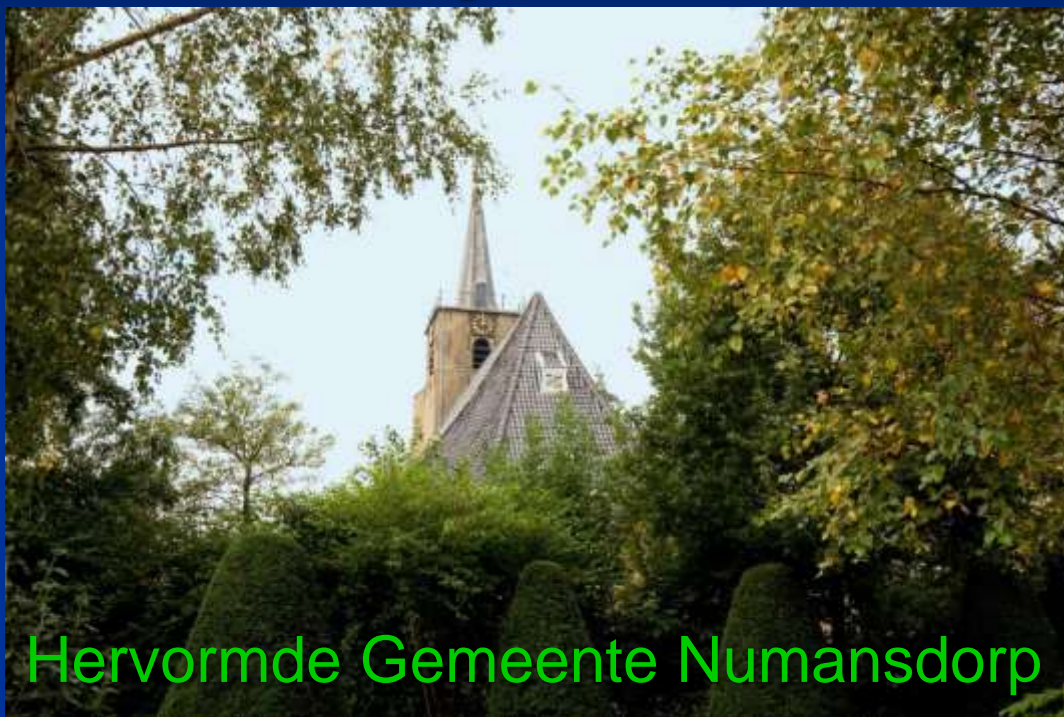
Hervormde Gemeente Numansdorp